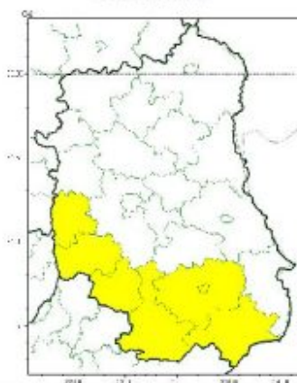
Burze z gradem

Instytut Meteorologii i Gospodarki Wodnej - Państwowy Instytut Badawczy Centralne Biuro Prognoz Meteorologicznych - Wydział w Warszawie 01-673 Warszawa ul. Podleśna 61 tel: 22 5694151, kom. 781774153, fax: 022-5694151 email: meteo.warszawa@imgw.pl www: www.imgw.pl