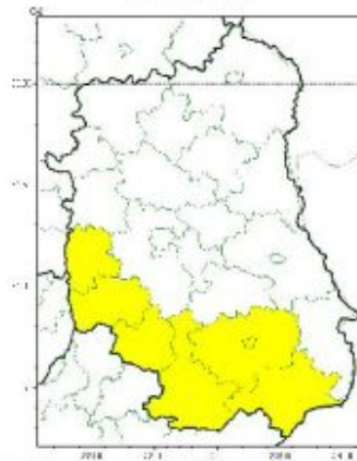
Burze z gradem