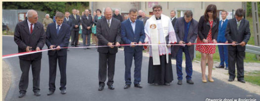
Otwarcie drogi w Rozłęczynie

W ostatnich tygodniach w gminie Wojsławice cztery wsie wzbogaciły się o przebudowane drogi z nowymi nawierzchniami. Otrzymały je: Stary Majdan, Trościanka, Rozłęczin i Putnowica Wielkie - Kurtytyn.