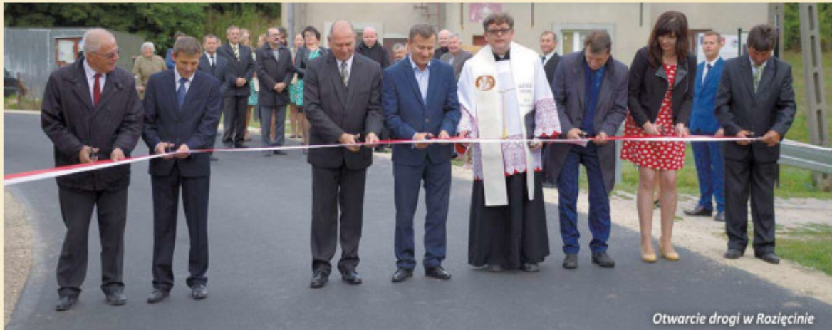
Otwarcie drogi w Rożęcinie

W ostatnich tygodniach w gminie Wojśławice cztery wsie wzbogaciły się o przebudowane drogi z nowymi nawierzchniami. Otrzymały je: Stary Majdan, Trościanka, Rożęcina i Putnowice Wielkie - Kurytyny.